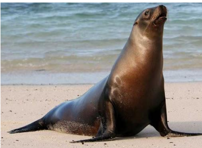
Lobo de Mar

4- Fauna: En sectores del desierto costero se encuentran especies tales como el guanaco, zorro culpeo, chilla, lobo de mar y numerosas gaviotas y pelícanos. En el Parque Nacional Pan de Azúcar, se encuentra el pingüino de humboldt. En el altiplano es factible ver vicuñas, flamencos chilenos, parinas grande y parinas chicas.