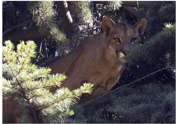
Imagen referencial.

a. Fíjate en la fecha de la noticia, ¿qué sucedía en la ciudad para que los pumas decidieran bajar de la precordillera?