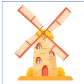
Molino de viento