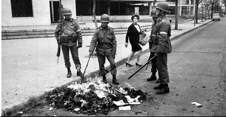
Militares quemando libros de políticas opositoras a la Dictadura Militar, Chile 1973.

Artículo 19: Todo individuo tiene derecho a la libertad de opinión y de expresión.